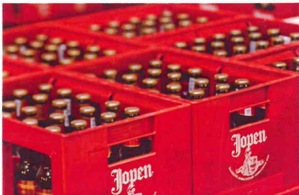
Jopen is onder de noemer streekproduct terug te vinden bij De Kweker.

In het juryrapport wordt Jopen geprezen om de kwaliteit van zijn bieren en het gebruik van authentieke, Middeleeuwse recepten die de relatie met de Haarlemse regio onderstrepen. Ook